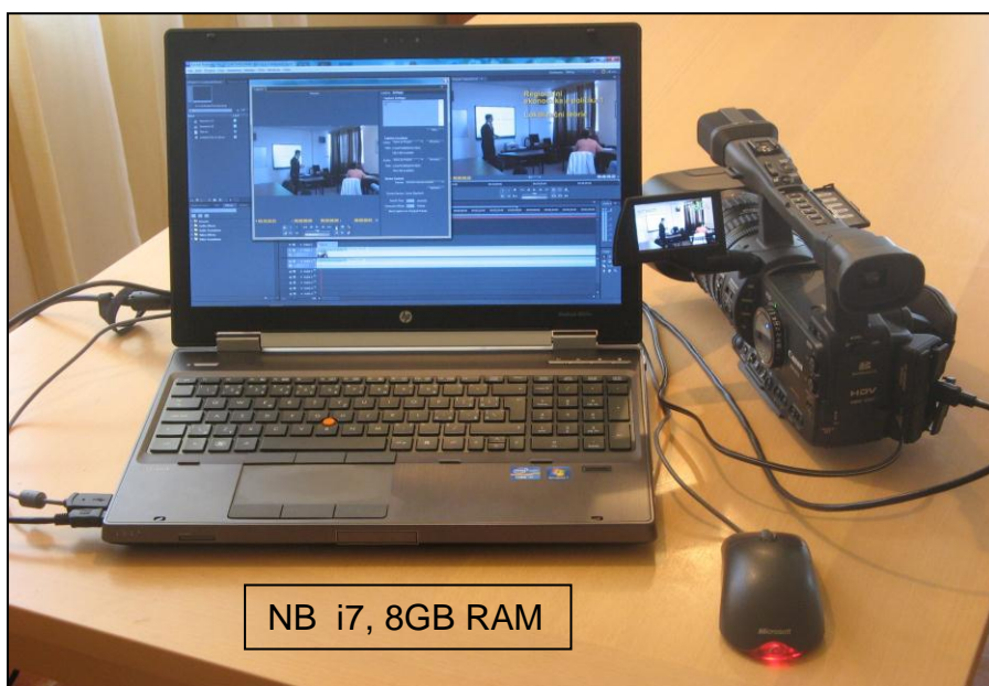
NB i7, 8GB RAM